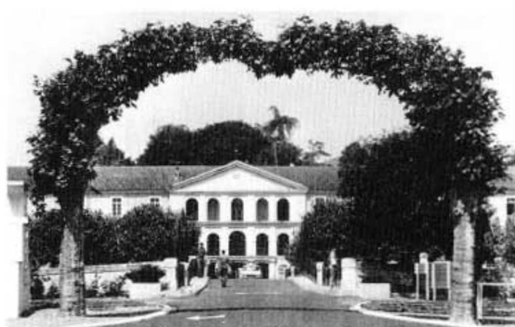
La caserne Espagne, un des deux pôles auscitains du "rendez-vous citoyen".