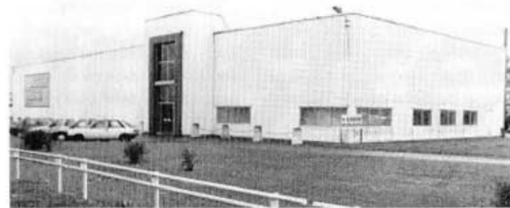
Un des bâtiments de la zone commerciale en cours de réalisation.

rieur et l'extérieur de son magasin. L'important bâtiment dit "Achille Zavatta" est déjà sollicité par plusieurs enseignes non alimentaires. Il est prévu pour celui-ci une passerelle piétons sur le ruisseau Saint-Laurent afin d'établir une liaison vers le supermarché Champion. D'autre part, dans le bâtiment situé le plus proche du Leader Price seront créés deux magasins à louer de 200 et 300 m 2 . Une zone d'accès et de parkings va être réaménagée en fonction de ces changements. Renseignements sur ces locations par téléphone au 05 62 69 76.