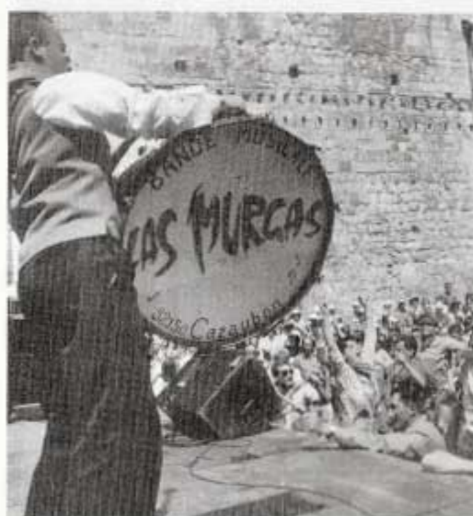
Avec Las Murgas et les autres bandas, ambiance assurée les 10 et 11 mai à Condom.