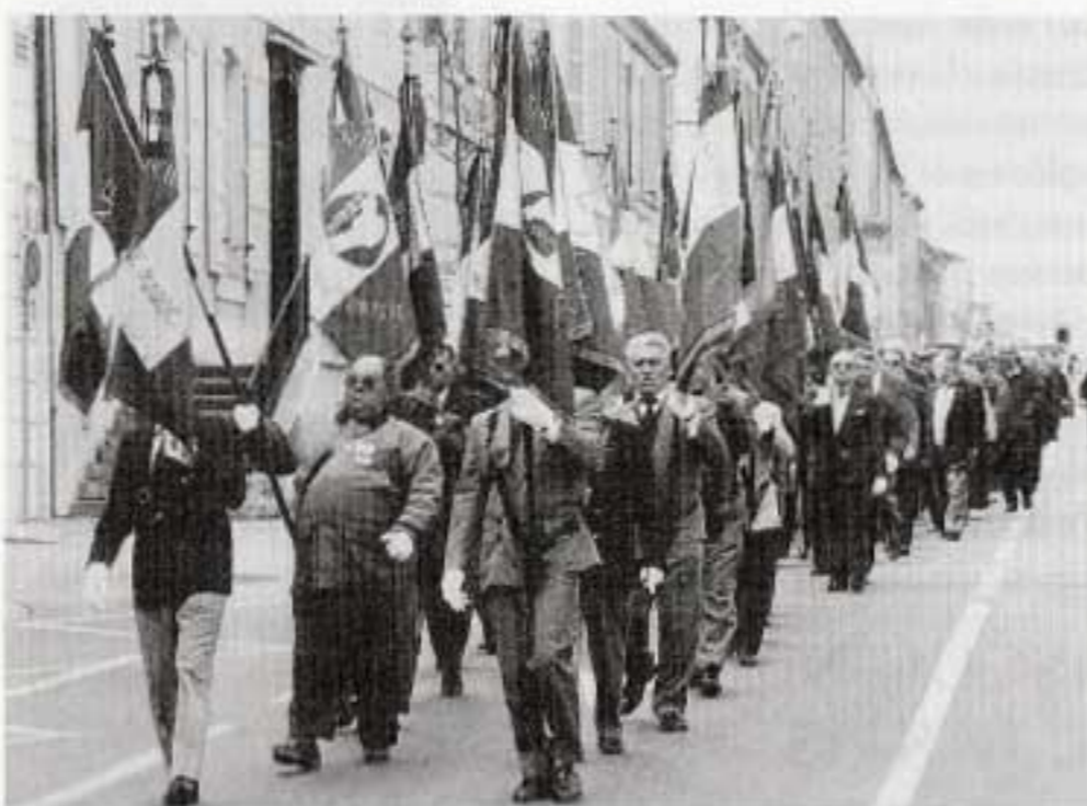
Le 35ème anniversaire commémoré avec une ferveur toute particulière