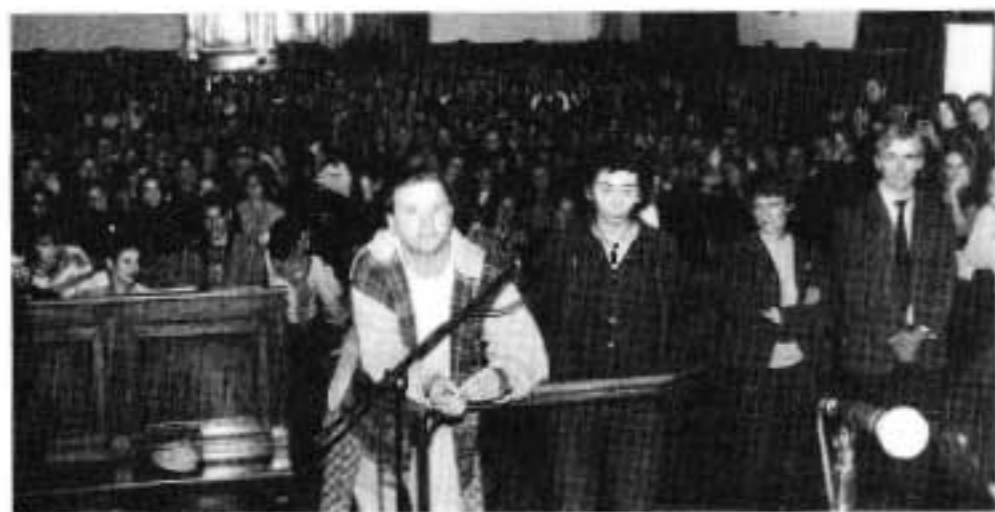
Grande foule au vrai faux procès des journées de la justice.

Au palais de justice d'Auch sous la haute main de Jean-Pierre Belmas, Président du Tribunal de Grande Instance, chaque année les journées Portes ouvertes, sont organisées avec tout le sérieux requis pour que le public puisse trouver ce qu'il vient chercher : essentiellement de l'information, du conseil, des réponses aux interrogations qui fait quoi ?, comment ça se passe ?, etc. En fait un vrai cours d'instruction civique grande nature, dans le cadre qui convient.