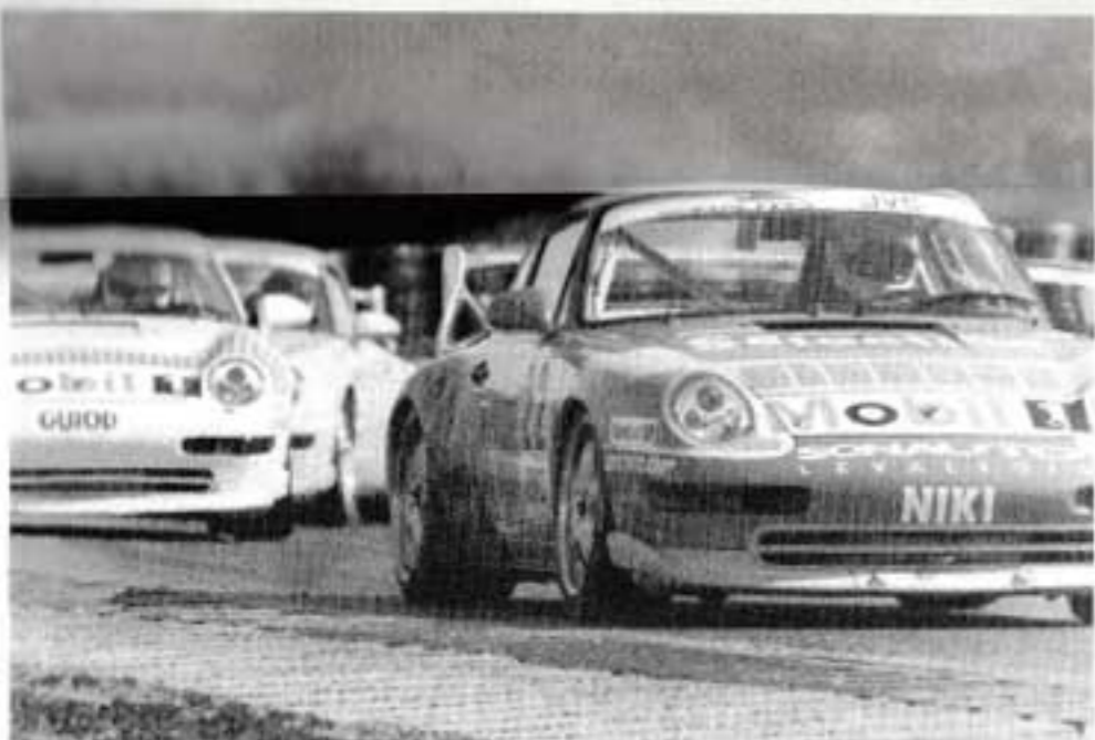
La Porsche Cup, l'une des épreuves phares des Coupes de Pâques.