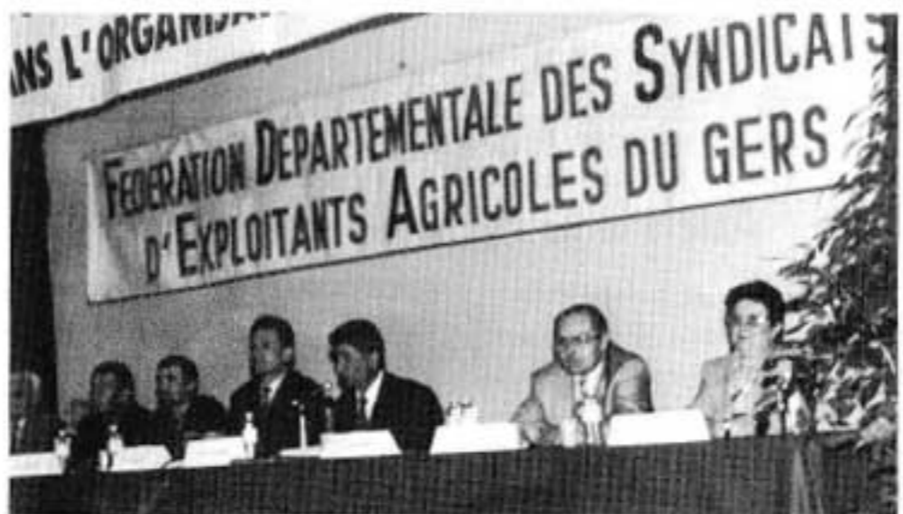
A la tribune de la FDSEA : "Viticulteurs de l'Armagnac, tenez bon !".