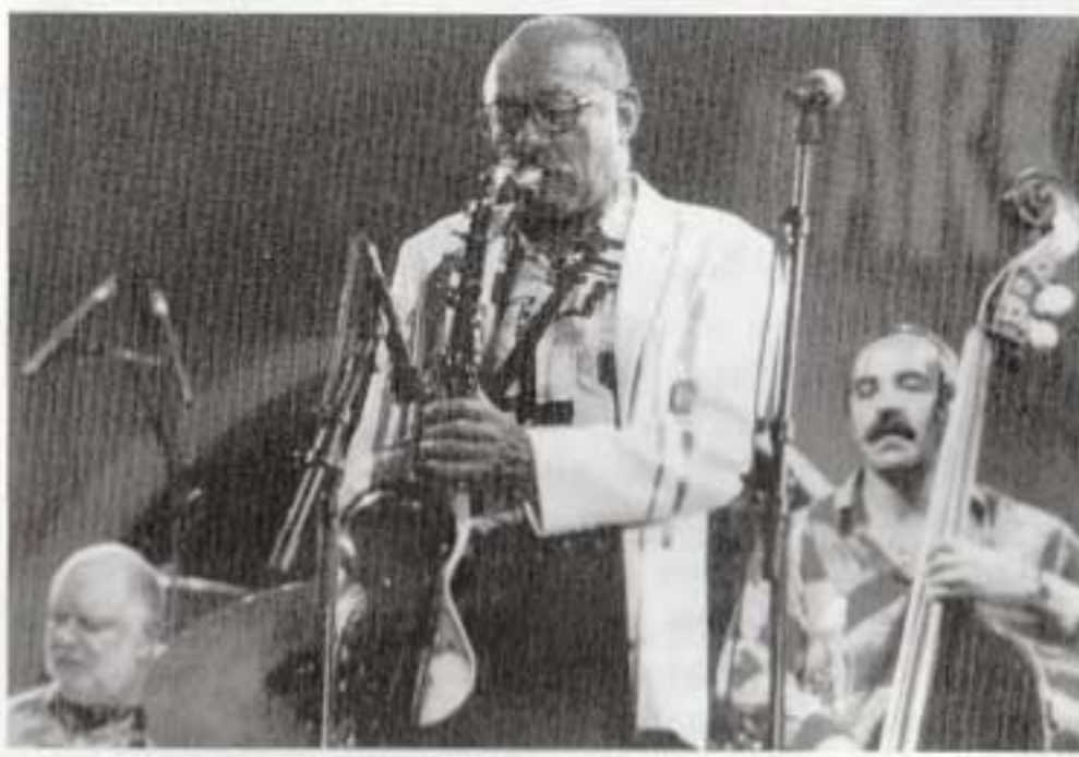
Pour le 20 ème festival de Marciac, Guy Lafitte en vedette le 14 août.

Mardi 12 août - Back to the roots : Riccardo Del Fra ; Ray Charles & The Giants of jazz : Phil Woods, Johnny Griffin, David Newman, Leroy Cooper, Roy Hargrove,