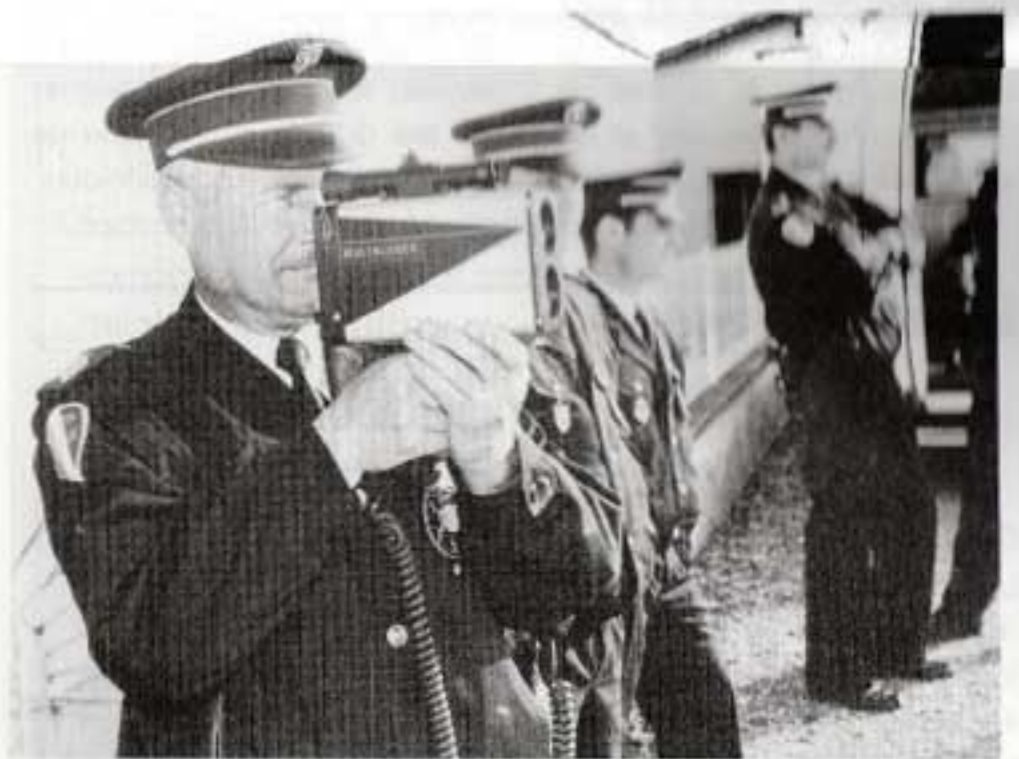
L'arme absolue contre les excités de l'accélérateur.

laser qui, de jour comme de nuit, lui permet de mesurer la vitesse des véhicules roulant vers lui. Déjà à 600 mètres, le véhicule peut être contrôlé et plusieurs autres mesures de vitesse peuvent être effectuées à mesure qu'il avance vers le fonctionnaire ou militaire utilisateur du Multalaser. A la différence des radars que l'on connaît et qui sont difficilement utilisables en ville, le Multalaser peut s'employer avec la même efficacité à la ville comme aux champs. En outre, il rend les opérations de contrôle bien plus faciles à organiser notamment parce que deux policiers (un pour viser, l'autre pour intercepter) suffisent. Vous voilà, nous voilà, prévenus !