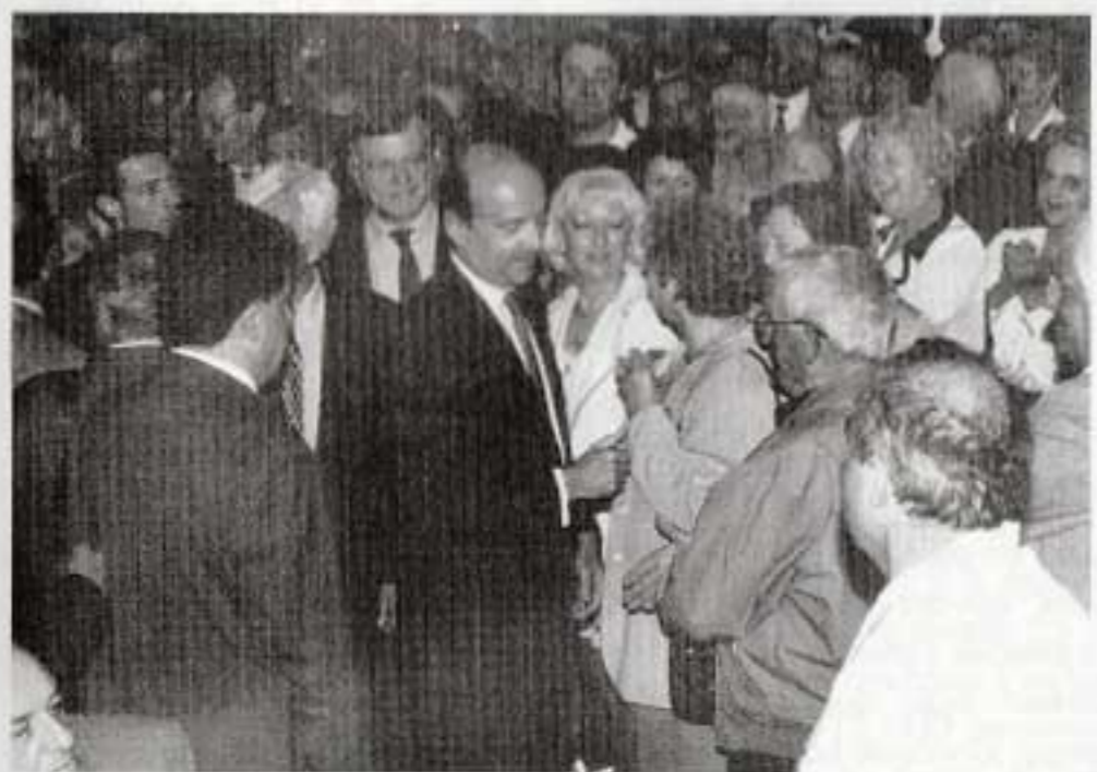
Bain de foule pour Alain Juppé sous l'œil du Député Aymeri de Montesquiou.

Estimant donc avoir eu la main heureuse, Alain Juppé et ses ministres ont-ils eu pour autant la main généreuse pour le département d'accueil ? Les élus de la majorité ont estimé que 120 millions de francs ont été promis même s'il n'est pas facile de distinguer, précisément, les sommes qui seraient de toute manière venues alimen-