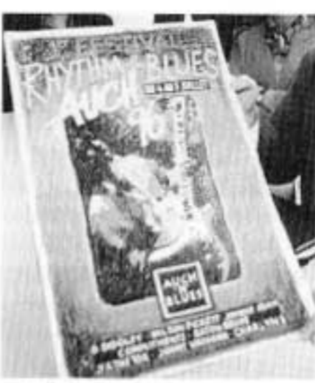
L'affiche du festival 96 ajourné, avant son re-démarrage 97.